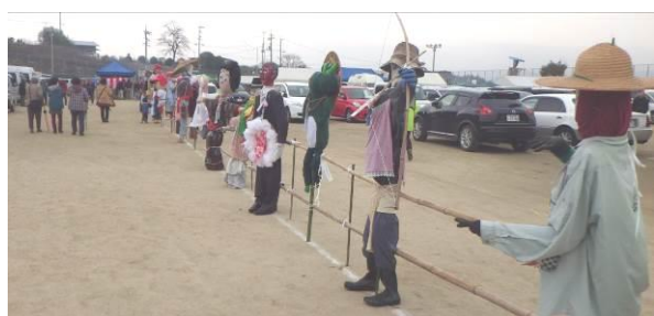
沢山のかかしが来場者をお出迎えます！

水土里ネット福山は、福山市立東村小学校と福山市立東村保育所の学校給食で使われる水稻の農業体験や松永幼稚園による農業体験を水土里レポートとして投稿しており、昨年に引き続き東村町かかし祭りを後援し、これまでに投稿した水土里レポートを展示しました。