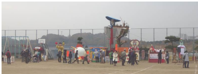
各地域から趣向を凝らしたかかしが勢揃い！

東村小学校の体育館には、東村小学校、東村保育所をはじめ給食食材納入グループ若草会や老人ホームなど沢山の出展がありました。みなさん大変力作で作品の一部は即売され大変盛り上がりました。