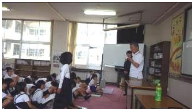
事前に勉強して、いっぱい質問しました！