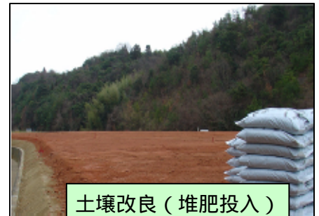
土壌改良(堆肥投入)