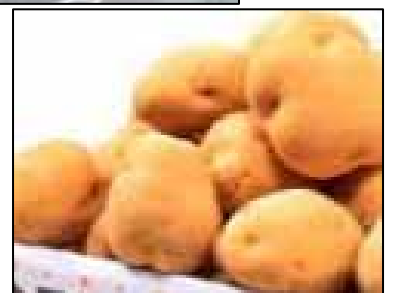
地域のブランド(ばれいしょ)