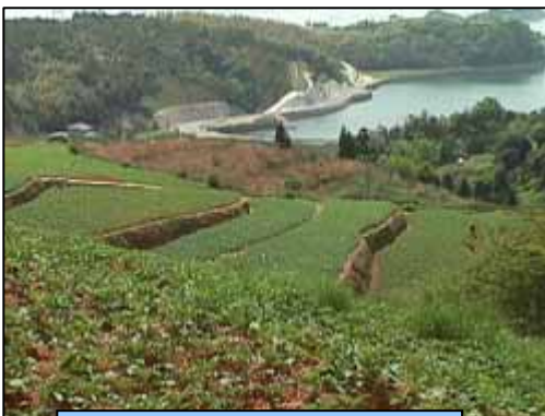
ばれいしょの栽培状況