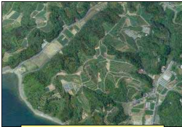
地域の農地の現状 (急傾斜の畑地)

有害鳥獣の被害及び病害虫の発生により耕作放棄地周辺の農家から耕作放棄地解消の要請があり、再生に向けた取組が必要となった。農業に参入した企業が、地形条件の良い耕作放棄地を探していた。