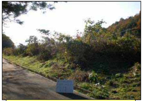
荒れている農地の現状