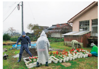
プランターを回収