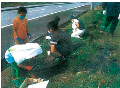
子ども会による花壇の整備

今後は、高齢化等諸問題に伴い担い手候補へ積極的に声掛けをしていく準備を進めています。