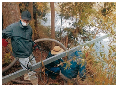
ポンプの補修作業