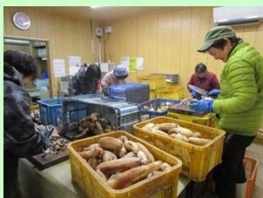
レンコンの出荷調整

フードロス削減への意識から、女性が中心となり廃棄されるレンコンの端を使ったチップスを考案し、商品化に力を入れています。実際、市内のホテルのメニューに加わることで、ホテルの朝食に並んだチップスを目にしたときの喜びが、今の活動の励みになっています。また、地域の農業者が高齢のため、機械化できる農作物を検討した結果、ウイスキーの原料となる大麦を栽培することとなりました。大麦は広島県産原料にこだわる蒸溜所に出荷予定であり、更なる特産品へとつながることが期待されます。