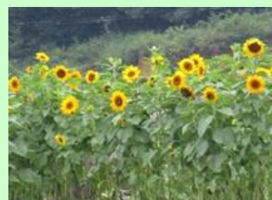
ひまわり植栽による景観形成活動