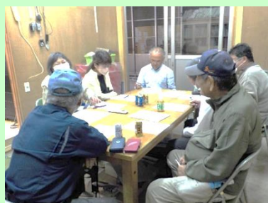
男女参画の活動計画策定